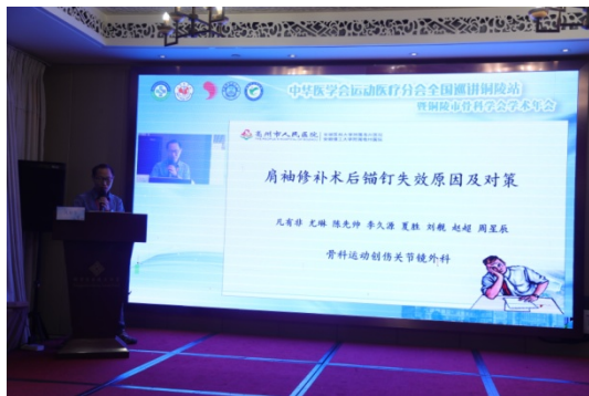
亳州市人民医院 凡有非主任