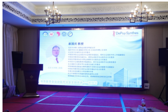
北京大学第三医院 崔国庆教授