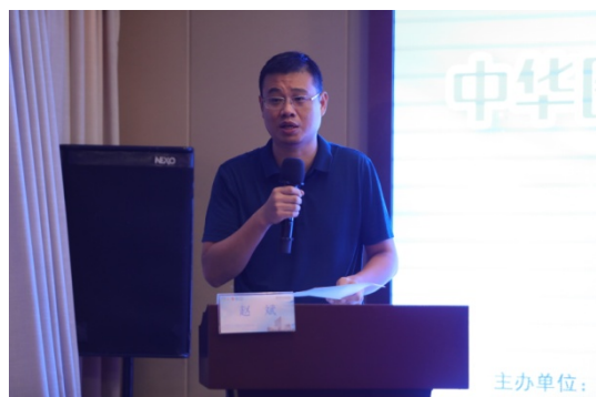
铜陵市卫健委主任赵斌 致辞